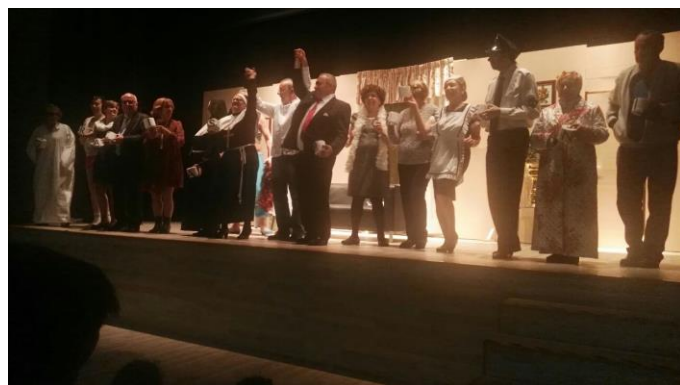
Recibindo e agradecendo os aplausos do público.

O pasado 17 de novembro tivemos unha divertida actuación no Centro Cívico do Castrillón cunha gran afluencia de público, que pasaron unha tarde moi agradábel e que se divertiron ao grande.