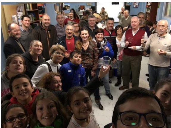
Alguns dos participantes na xuntanza.