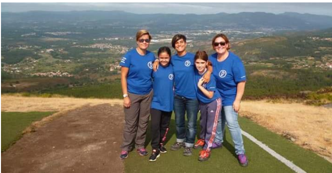
Algunhas das aventureiras.

E así foi o pasado 10 de setembro: un grupo de Tanxedoiras fomos facer... PARAPENTE!