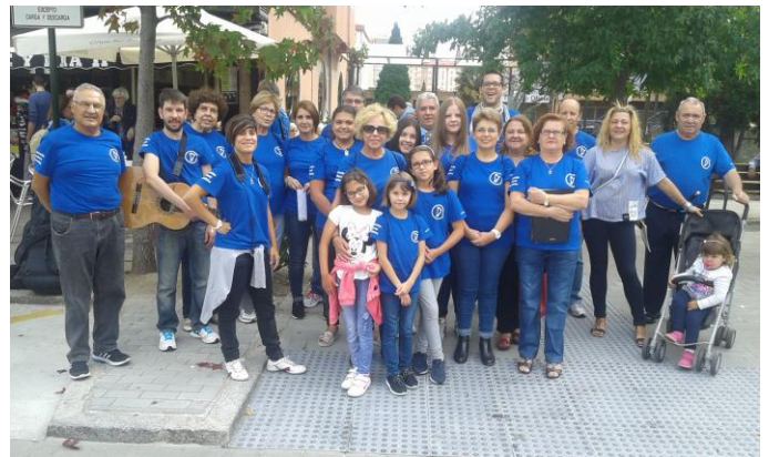
A "marea azul" chegou a Elviña.

O día 24 de setembro a Asociación Cultural Tanxedoira participou nas Festas da Milagrosa, cos seus cantos de taberna. Alí coincidiu con outros dous grandes grupos, Cantareiros do Naval e Aires de Sigrás, os cales tamén participaban deste evento organizado polos Comerciantes Boulevard Elviña.