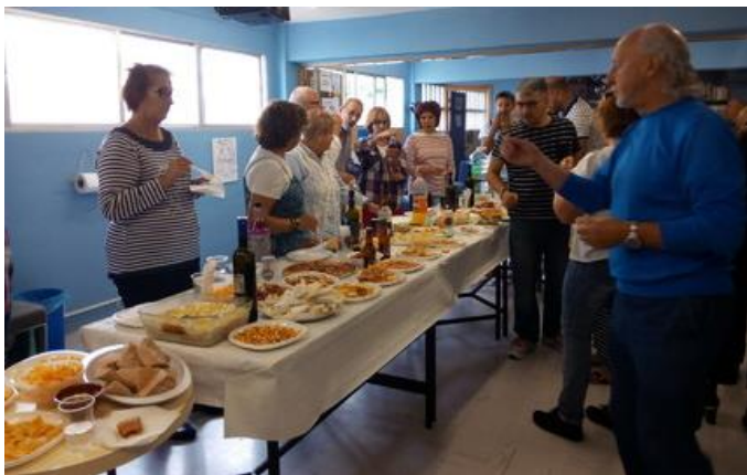
Preparados, listos, ¡XA!

Como vén sendo tradición en todos os comezos de cursos e na ASOCIACIÓN TANXEDOIRA, o sábado 1 de outubro celebrouse entre os socios e as socias unha comida de inauguración de curso.