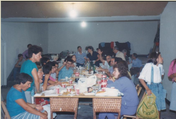
1989.- Local de Tanxedoira no lavadoiro de Monelos.

/persoa. Inscripción: lista de asistencia no local ou a través do Telegram.